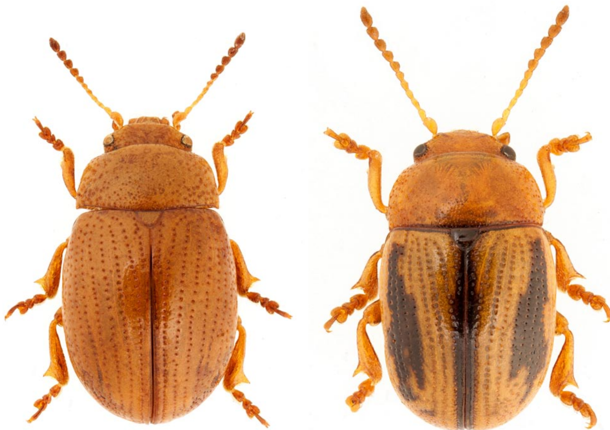
Obr. 1. Mandelinka Gonioctena olivacea : typicky zbarvený exemplář (vlevo) a exemplář s tmavou kresbou na krovkách (vpravo).

5856: Nymburk, VIII.1954, 1 ex., Fabický lgt., NMP.