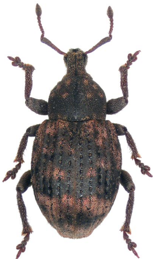
Obr. 7. Tropiphorus ochraceosignatus Boheman, 1842. Slovakia: Devínska Nová Ves. Fig. 7. Tropiphorus ochraceosignatus Boheman, 1842. Slovakia: Devínska Nová Ves.

( Abies alba ) (BURAKOWSKI et al. 1995), ojediněle jsou uváděny též nálezy z borovice lesní ( Pinus sylvestris ) (ROUBAL 1937–1941). Z území České republiky jsme druh pro Čechy prezentovali jen jako nespolehlivě prokázaný (BENEDIKT et al. 2010), když jsme neznali žádný doklad a jen jedinou publikaci FLEISCHERA (1927–1930), který pouze citoval historické údaje jiných sběratelů z lokalit Karlovy Vary, Litoměřice, Jirny a Písek. Věrohodnost těchto údajů jsme nepovažovali za spolehlivou vzhledem k poměrně obtížnému určení nosatce a absenci jiných údajů. Výše uvedený starší údaj o nálezu nosatce v podhůří Orlických hor a především početné nové nálezy brouka z kaňonu Střely v západních Čechách příslušnost tohoto druhu k fauně Čech definitivně potvrzují. Naopak je nutné revidovat výskyt na Moravě, kde jsme druh klasifikovali jako potvrzený historickým nálezem na základě údaje HORIONA (1935) z lokality „Bad Landeck in Glatzer Gebirge“. Tato lokalita ale leží již na polském území (městečko Łądek-Zdrój). Pro Moravu tedy zůstává M. punctulata prozatím nepotvrzený. V okolí Střely byl brouk sbírán na všech uvedených lokalitách oklepem zasychajících větví jedle bělokoré ( Abies alba ) (Obr. 9). Potvrzení výskytu druhu v Čechách.