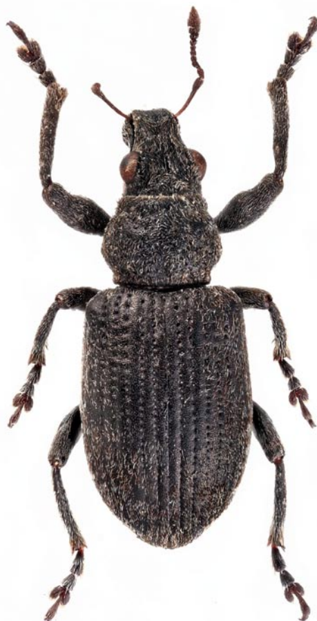
Obr. 6. Coelositona cambricus (Stephens, 1831). Moravia: Louky nad Olší.

Fig. 5. Otiorynchus smreczynskii Cmoluch, 1968. Bohemia: Praha.