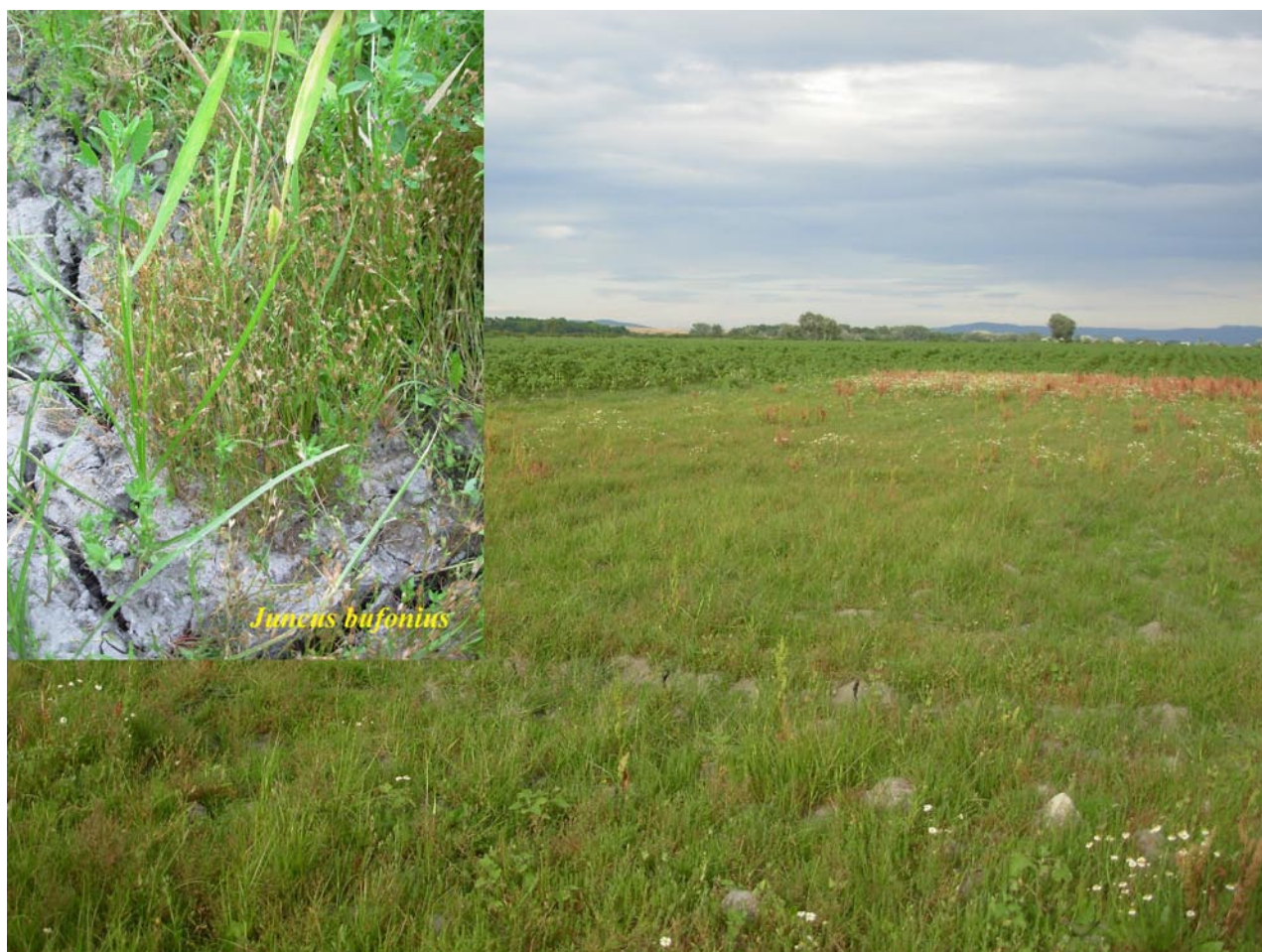
Obr. 4. Lokalita Jurský Chlm – stanoviště Bagous lothari (s detailem potenciální živné rostliny Juncus bufonius ).

Evropský druh, rozšířený od Britských ostrovů na východ po Estonsko, s absencí ve Skandinávii, na jih zasahující na Balkán, do Turecka a severní Afriky (Maroko) (VELÁZQUEZ DE CASTRO 2013). V České republice je tento druh doložen převážně ze západní poloviny Čech, odkud byl publikován sice jen dvakrát: Rumburk (DIECKMANN 1980) a Horní Jiřetín (BOROVEC 1984), další nálezy z této oblasti jsou ale autorům známy a doloženy z řady lokalit především západních a severních Čech. Z Moravy druh veden nebyl (STREJČEK 1993, BENEDIKT et al. 2010). Teprve dodatečně jsme zjistili historické záznamy v pracích