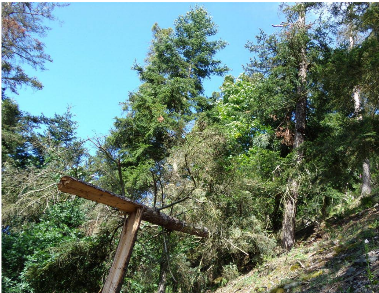
Obr. 9. Lokalita Rabštejn nad Střelou – stanoviště Magdalis punctulata . Fig. 9. Locality Rabštejn nad Střelou – habitat of Magdalis punctulata .