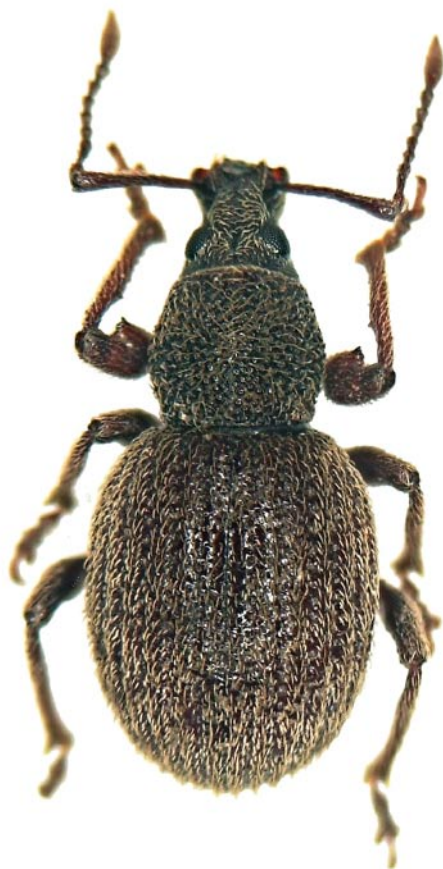
Obr. 5. Otiorynchus smreczynskii Cmoluch, 1968. Bohemia: Praha.

ranová“ (pravděpodobně se jedná o vrch Baranovo severně od Banské Bystrice) a Silica ve Slovenském krasu, přičemž první z nálezů je dokladován v jednom ex. v jeho sbírce v SNMB (S. Benedikt revid.). Další údaje jsme našli v kartotéce J. Strejčka, který eviduje svoji determinaci 2 ex. z Plešivce (Slovenský kras): VI.1969, R. Veselý lgt. et coll. Obecně pro Slovensko pak uvedli druh např. DIECKMANN (1983) a STREJČEK (1993). Vzhledem k dávno známému a opakovaně potvrzenému výskytu nosatce na Hainburských kopcích v Rakousku (např. DIECKMANN 1983 a poznatky druhého z autorů), které leží nedaleko od Bratislavy za Dunajem, byl výskyt také na slovenské straně Dunaje očekáván. Všechny nové kusy byly společně s dalšími druhy rodu T. micans a T. elevatus sebrány smykem v doubravě z Allium ursinum , který na lokalitě vytváří kobercové porosty. Vazbu druhu na tuto rostlinu zmiňuje již DIECKMANN (1983). Nález na slovenské straně Dunaje dává předpoklad většího rozšíření druhu na dalších lokalitách především v Malých Karpatech a vyloučit nelze ani výskyt v blízkých oblastech jižní Moravy. Potvrzení recentního výskytu druhu na Slovensku.