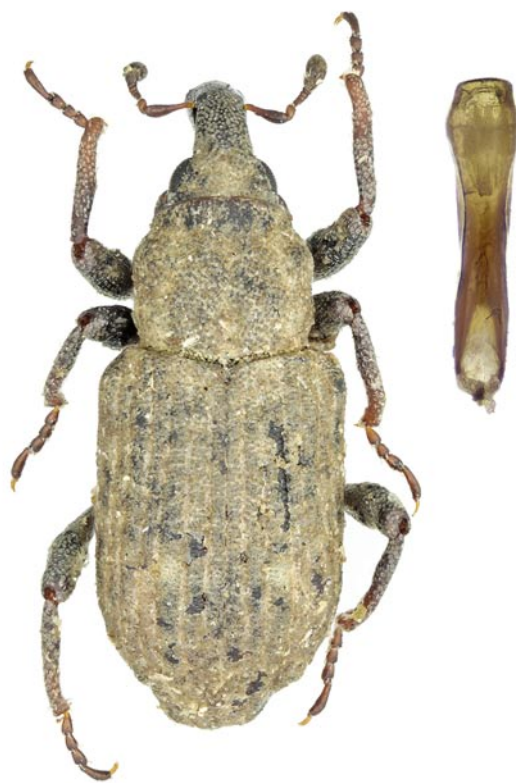
Obr. 3. Bagous brevis Gyllenhal, 1836 – habitus dorzálně, aedeagus ventrálně. Finland: Luumäki.

Vzácný a málo známý panonský druh z blízkého příbuzenstva B. brevis Gyllenhal, 1836 (Obr. 3; rozlišení obou druhů je uvedeno na konci komentáře), hlášený dosud pouze z Maďarska, Rakouska a Srbska (CALDARA 2013b). V Maďarsku byl B. lothari sbírán zřejmě pouze na světlo (A. Podlussány, pers. comm.). Oba nové nálezy na Slovensku byly učiněny na vzájemně podobných biotopech, které jsou entomologicky zpravidla opomíjeny – okraje polí na zasolených půdách, které byly v jarních měsících pravděpodobně silně podmáčené, zůstaly neoseté a s poklesem vody se zde vytvořily slané úhory, které rychle osídlily některé pionýrské rostliny (např. Juncus bufonius , Lythrum hyssopifolia , Veronica sp. a další) (Obr. 4). Živná rostlina nosatce je dosud neznáma. Pro zmíněný příbuzný druh B. brevis je uváděna vazba na prskyňník plamének ( Ranunculus flammula ) (DIECKMANN 1983). Na lokalitě u Jurského Chlmu byla však většina kusů B. lothari sebrána večerním a nočním osmykem sítiny žabí ( Juncus bufonius ), na které byl také přímo v místě nálezu v červnu odchycen 1 ex. exofágní larvy rodu Bagous . Příslušnost larvy ke druhu B. lothari se však kvůli jejímu uhynutí nepodařilo potvrdit a nabízené vyřešení otázky živné rostliny pak dále zkomplikovalo zjištění na stejné lokalitě dalšího příbuzného druhu B. lutulosus (Gyllenhal,