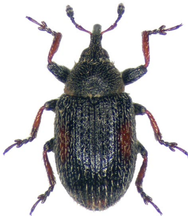
Obr. 1. Gymnetron tibiellum Desbrochers, 1899. Bohemia: Úhošťany.

1 ex., J. Krošlák lgt. et coll., S. Benedikt det. Jihoevropský druh s výskytem ve většině zemí východního Mediterránu. Ve střední Evropě zasahuje do České republiky, Rakouska, Maďarska a na Slo-