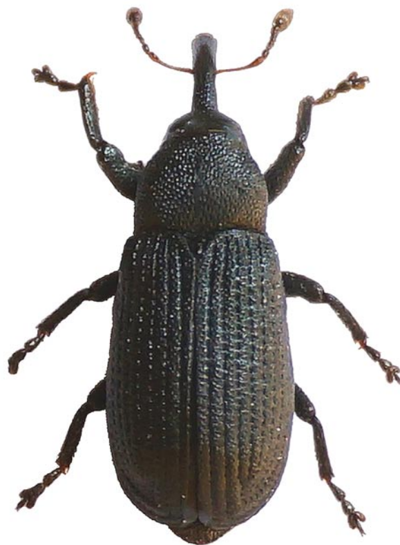
Obr. 8. Magdalis punctulata (Mulsant & Rey, 1859). Bohemia: Rabštejn nad Střelou. Fig. 8. Magdalis punctulata (Mulsant & Rey, 1859). Bohemia: Rabštejn nad Střelou.